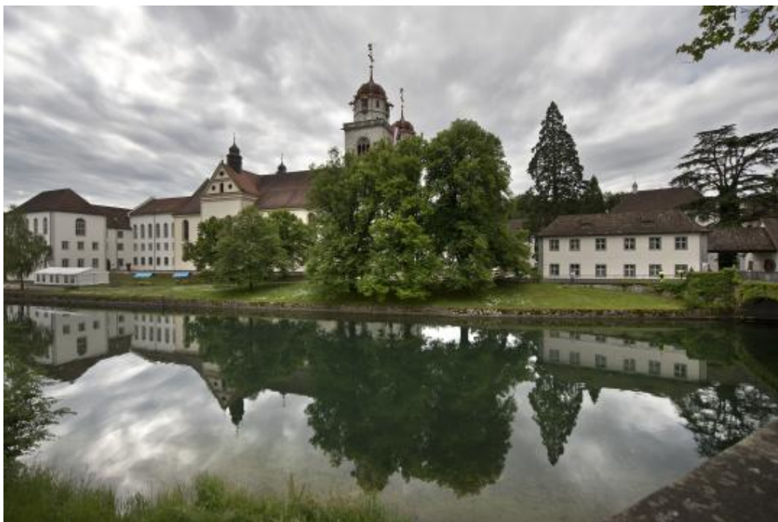
Auf der Klosterinsel Rheinau findet sich die Stiftung Schweizer Musikinsel Rheinau.

Seit zweieinhalb Jahren herrscht auf der ehemaligen Klosterinsel Rheinau wieder Betrieb. Noch schreibt die Stiftung von alt Bundesrat Christoph Blocher jedoch ein Defizit.